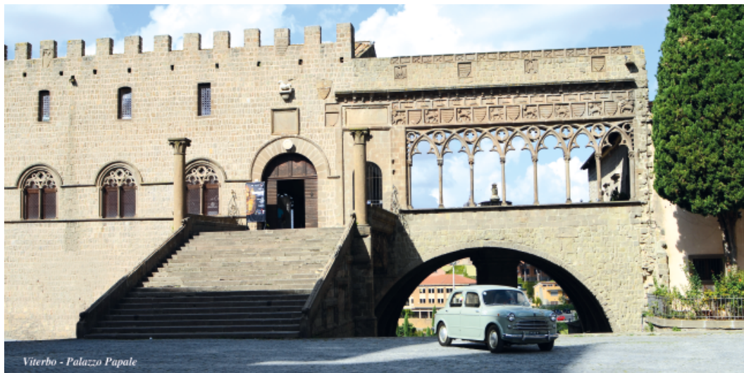
Viterbo - Palazzo Papale