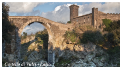
Castello di Vulci - Vulci