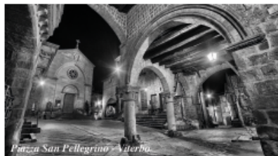
Piazza San Pellegrino - Viterbo

N.B. Il programma deve intendersi provvisorio, suscettibile di variazioni senza responsabilità alcuna per l'organizzazione. Durante le varie giornate si svolgeranno le prove cronometrate che determineranno la classifica della gara di regolarità.