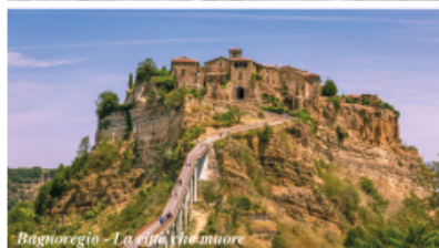
Bagnoregio - La città che muore